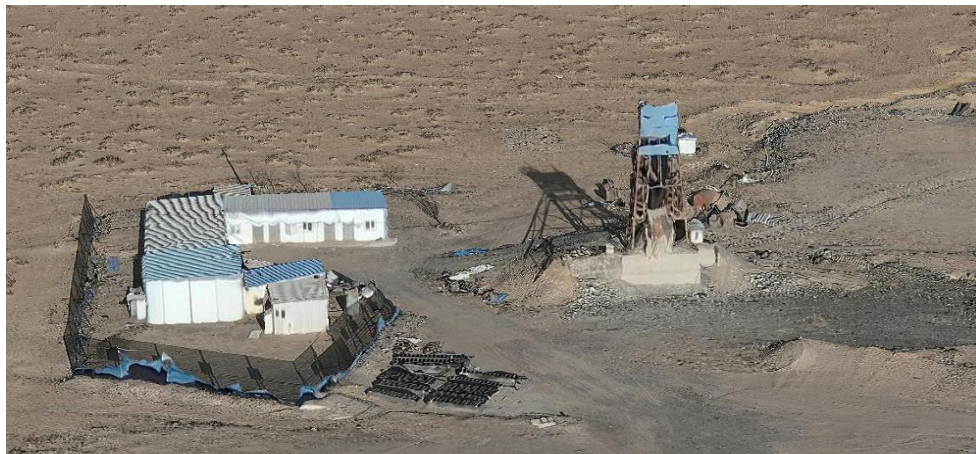
照片3-4 西风井工业场地

间)。根据第三次全国土地调查土地利用现状图，西风井工业场地损毁土地类型为采矿用地。