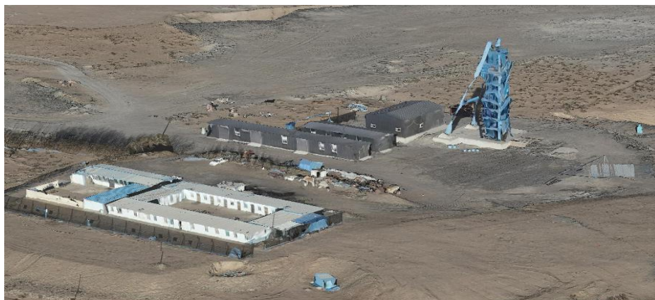
照片3-5 东风井工业场地

东风井工业场地：位于主竖井工业场地东约 95m，东风井工业场地占地面积 5207m 2 。风井井口坐标：X=****，Y=****，Z=1128，井筒净直径 4.0m。通风竖井与主竖井形成单翼对角式机械抽出式通风系统，同时兼作提升井。根据第三次全国土地调查土地利用现状图，东风井工业场地损毁土地类型为采矿用地。