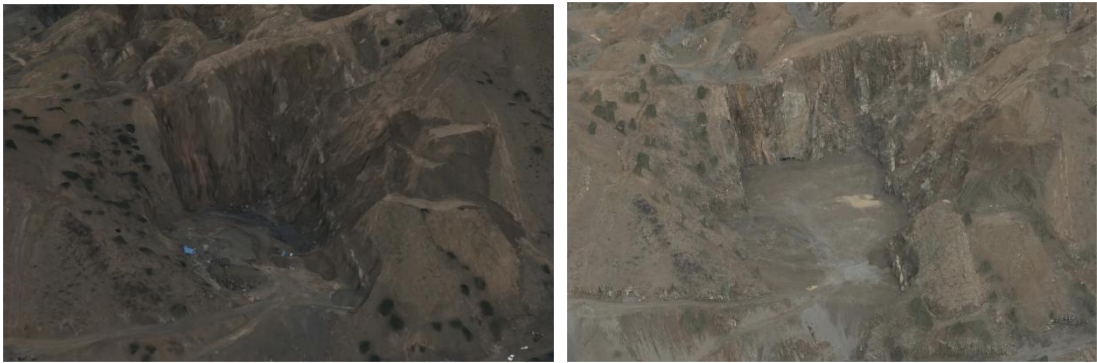
照片 2-1 采坑坑底回填、清除危岩体、覆土、平整、恢复植被（治理前后对比图）

治理工程完成土地损毁治理面积 22.73hm 2 ，共计投入资金***** 万元。