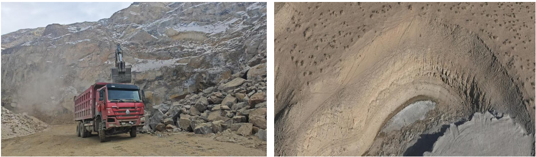
照片 2-3 CK12 治理前后对比照片