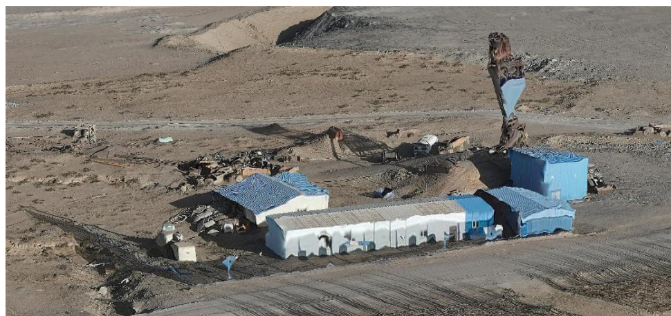
照片3-3 主竖井工业场地

主竖井工业场地：位于矿区北中部，主竖井工业场地占地面积 5321\text{m}^2 ，由单层钢结构简易建筑、竖井组成。主竖井井口坐标：X=****，Y=****，Z=1132m，井筒为圆型断面，净直径 4.0m，配备单层铝合金罐笼提升，内设梯子间、卷场机房、交配电室、材料库、值班室、休息室等。根据第三次全国土地调查土地利用现状图，主竖井工业场地损毁土地类型为采矿用地。