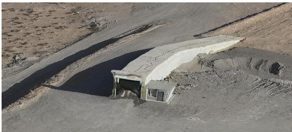
照片3-6 斜坡道工业场地

斜坡道工业场地位于主竖井工业场地南西 220m，占地面积 4144m 2 。斜坡道开口坐标：X=****，Y=****，标高 1128.5m。根据第三次全国土地调查土地利用现状图，斜坡道工业场地损毁土地类型为其他草地、采矿用地。