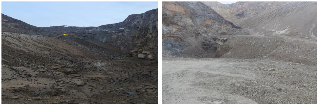
照片2-4 CK13治理前后对比照片